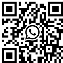
WhatsApp 계정 추가