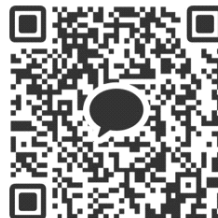
Kakaotalk 계정 추가